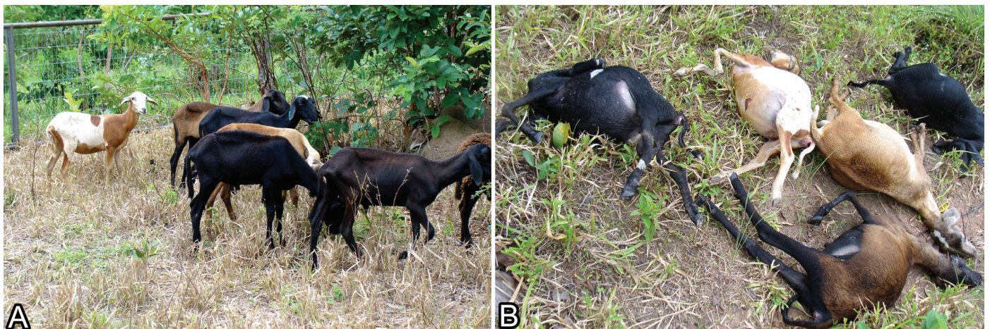
Fig.1. (A) Ovinos mantidos em recinto antes do ataque de Puma concolor , janeiro de 2010. (B) Carcaças de cinco ovelhas após ataque depredatório de Puma concolor a ovinos. Alto Paraguai, MT, fevereiro de 2010.

No dia seguinte a onça-parda retornou ao local da carcaça e foi abatida por caçadores contratados para tal fim. Os autores são expressamente contrários ao abate de carnívoros silvestres e somente reportam o fato, afim de manter a descrição dos eventos de maneira imparcial. A Lei nº 5.197, de 3 de janeiro de 1967 dispõe sobre a proteção à fauna e dá outras providências. O Artigo 1º protege a fauna silvestre, sendo proibida a sua utilização, perseguição, destruição, caça ou apanha (Brasil 1967).