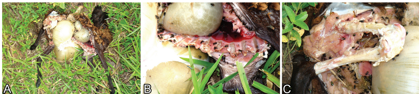
Fig.3. (A) Carcaça de ovelha parcialmente consumida por Puma concolor . Alto Paraguai, MT. Fevereiro de 2010. (B) No tórax observa-se ausência dos pulmões e coração, porções distais das costelas, músculos intercostais, cartilagens costais, esterno. O retículo foi intocado pelo predador e estava deslocado para a cavidade torácica. (C) Membro posterior direito com exposição do fêmur e da tíbia e ausência dos músculos esqueléticos.