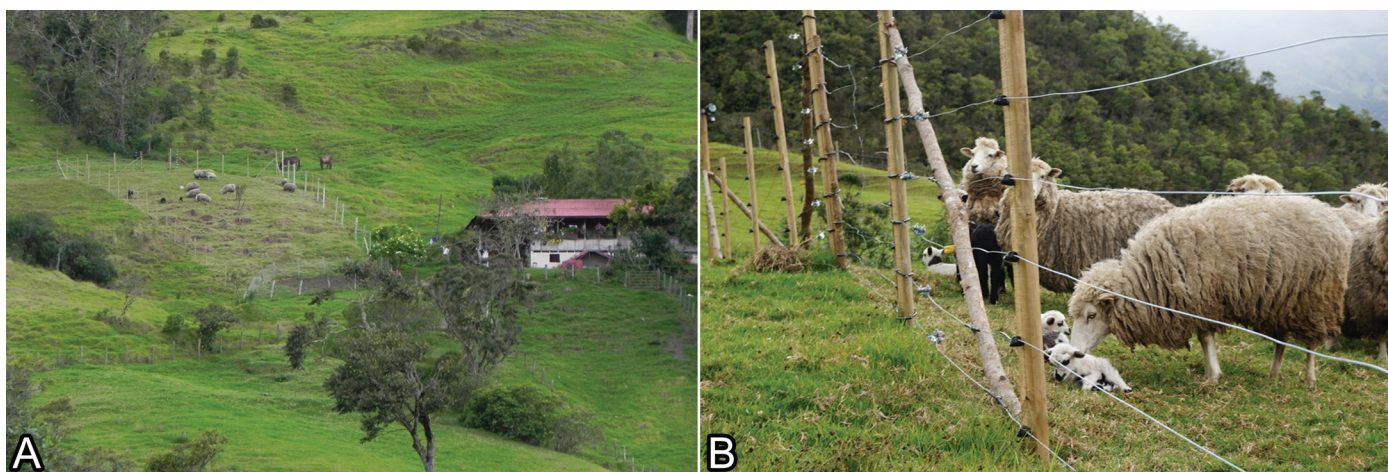
Fig.5. (A) Curral anti-depredação com cerca elétrica, como uma amostra do que pode ser feito de forma efetiva para controlar a depredação. Vereda Santa Lucia, Municipio Tuluá, Cordillera Central, Valle del Cauca, Colombia. (B) Detalhe da cerca em funcionamento, com oito fios eletrificados e as ovelhas no interior do curral anti-depredação.

Uso estratégico de cercas. Sempre que possível deve-se cercar áreas de mata ou floresta para impedir a entrada do gado, que pode se tornar uma presa vulnerável nessas áreas (Hoogesteijn & Hoogesteijn 2011, 2014). Cercas elétricas (especialmente desenhadas para evitar a entrada dos felinos e a saída das criações domésticas) podem diminuir a depredação de animais domésticos, podendo ter alta eficácia em algumas situações (Hoogesteijn & Hoogesteijn 2014, Hoogesteijn et al. 2016b). Para que evitem a passagem de felinos, as cercas elétricas devem ser utilizadas em áreas pequenas como currais de fechamento noturno, piquetes pequenos, piquetes maternidade ou áreas com histórico de depredação. Deve-se considerar que, assim como os animais de criação, os animais silvestres aprendem a evitar cercas elétricas. Contudo, os felinos têm maior capacidade de adaptação para invadir as áreas cercadas, o que ressalta a necessidade de considerar um profissional capacitado para realizar o planejamento e a instalação das cercas elétricas (Cavalcanti et al. 2011), e que sejam especialmente desenhadas com essa finalidade