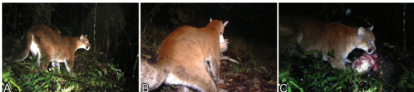
Fig.4. Ataque depredatório de onça-parda a ovinos registrado com armadilhas fotográficas pela equipe da Panthera Colômbia nos Andes Colombianos, em 3.000m de altitude. (A) Onça-parda se deslocando em direção ao cercado dos carneiros. (B) Onça-parda com uma ovelha mordida na garganta. (C) A onça-parda regressou ao local do ataque depredatório para consumir a carcaça da ovelha.