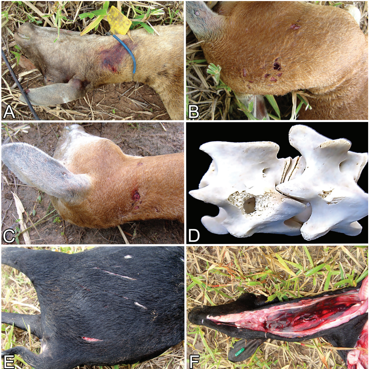
Fig.2. Lesões em ovinos atacado por Puma concolor no estado de Mato Grosso, Brasil, em fevereiro de 2010. (A-C) Feridas perfurantes na região cervical atlanto-axial dorsal. (D) Perfuração de vértebras cervicais. (E) Feridas perfurantes na região cervical atlanto-axial dorsolateral e hemorragia. (F) Músculos cervicais com sufusão da região submandibular à região cervical profunda.

Outros casos de depredação, dos quais não foi possível serem realizadas necropsias, o diagnóstico foi baseado nos sinais característicos deixados nas presas (Hoogesteijn et al. 1993). Os diagnósticos realizados nesta mesma propriedade entre 2005 e 2014 estão apresentados no Quadro 1 e os casos de depredação representaram 46% das mortes no período estudado. As principais doenças diagnosticadas nesta propriedade foram a calcinose enzoótica (Guedes et al. 2011) e a pitiose rinofacial (Ubiali et al. 2013).