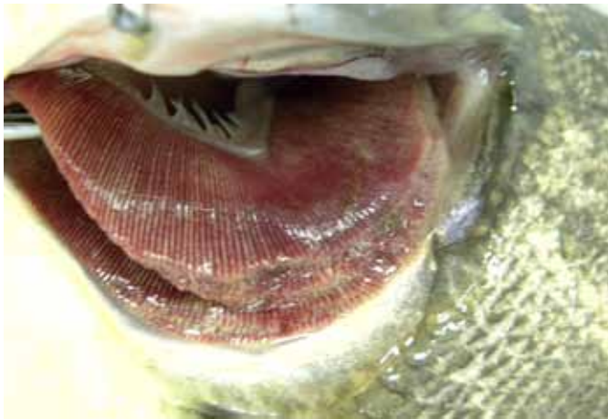
Fig.1. Piaractus mesopotamicus com áreas multifocais de palidez nas brânquias e acúmulo de exsudato mucoso esbranquiçado (Surto 1).

morfologia consistente com Piscinoodinium pillulare (Fig.2 e 3). Alguns poucos cistos de 70-130µm de diâmetro possuíam esporos fusiformes e alongados, identificados como Henneguya spp. (Fig.3). Tanto P. pillulare , quanto Henneguya spp.