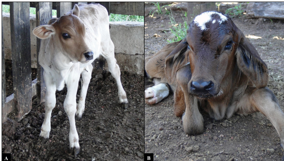
Fig.1. Bócio em bovinos no Estado de Mato, Grosso. (A,B) Bezerros da Propriedade A em que se evidencia aumento bilateral de volume na região cervical ventral.

O segundo caso ocorreu em abril de 2016 em uma propriedade na área rural da cidade de Várzea Grande (15°38'49"S 56°07'58"O) (Propriedade B). No local eram criadas três vacas Girolando e um touro Nelore mantidos em piquetes com pastagem degradada e água à vontade. No período da seca, entre maio e setembro, os bovinos recebiam casquinha de soja e cevada. Durante o ano todo recebiam ainda suplementação mineral no cocho, que era composta por duas partes de sal branco não iodado e uma parte de sal mineral comercial. O manejo reprodutivo era através de monta natural. A proprietária informou que no ano anterior dois bezerros nasceram letárgicos, proporcionalmente pequenos e morreram poucas horas após o nascimento, mas