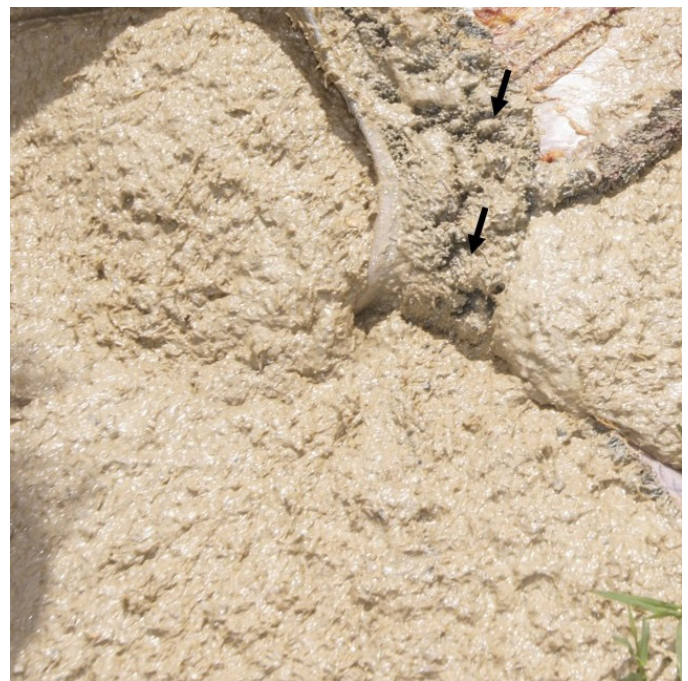
Fig.2. Rúmen bovino, acidose por soro de leite. Conteúdo ruminal após a ingestão de soro de leite e junção de grupos de papilas na mucosa (setas).