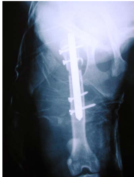
Fig.5. Imagem radiográfica de 7 dias de pós-operatório. Notar o posicionamento da haste e parafusos.

manho do pino escolhido (Fig.3). O orifício foi realizado através das duas corticais, com a broca alcançando a cortical distal por transposição do orifício existente na haste. As duas corticais foram então machadas, e o parafuso fixado, bloqueando a haste (Fig.5).