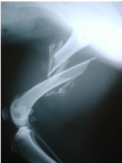
Fig.4. Imagem radiográfica em posição latero-lateral do animal nº 6, revelando fratura cominutiva em diáfise femoral.

O osso foi previamente fresado, para que nenhuma força adicional fosse necessária durante a introdução da haste. Para inserção da haste, foram adotadas as vias normógrada ou retrógrada e foram realizados bloqueios com três ou quatro parafusos de titânio de 2,0mm de diâmetro. Em relação aos bloqueios, utilizaram-se as marcações específicas do guia, para o ta-