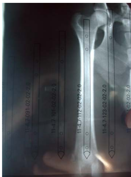
Fig.1. "Template" padrão feito em filme de transparência alocado por sobre a radiografia de fêmur em posição crânio-caudal do membro contralateral do animal nº 6 para definição dos tamanho ideal do pino.

Adotou-se como padrão exame radiográfico tanto da região fraturada quanto do membro contralateral durante o atendimento inicial. Com auxílio de filme de transparência padrão que acompanha o instrumental de hastes bloqueadas, alocado por sobre a radiografia do membro íntegro, foram definidos os tamanhos ideais de pinos a serem utilizados no membro fraturado em cada caso (Fig.1 e 4).